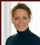
Ivonne Albinus Berufsbildene Schulen Buchholz