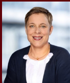
Dr. Dagmar Wolf Bildungsexpertin „Brücken bauen im Bildungssystem – Wie Kooperation, gemeinsame Ver- antwortung und systemische Qualität eine neue Schulrealität ermöglichen“