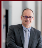
Grant Hendrik Tonne Minister Niedersächsisches Ministerium für Wirtschaft, Verkehr und Bauen