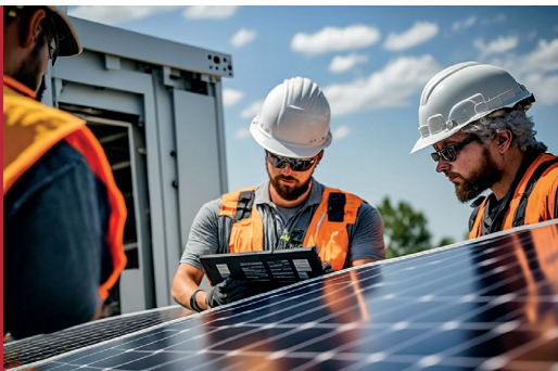
Dieses Bild ist KI-generiert. Die dargestellten Personen existieren nicht.